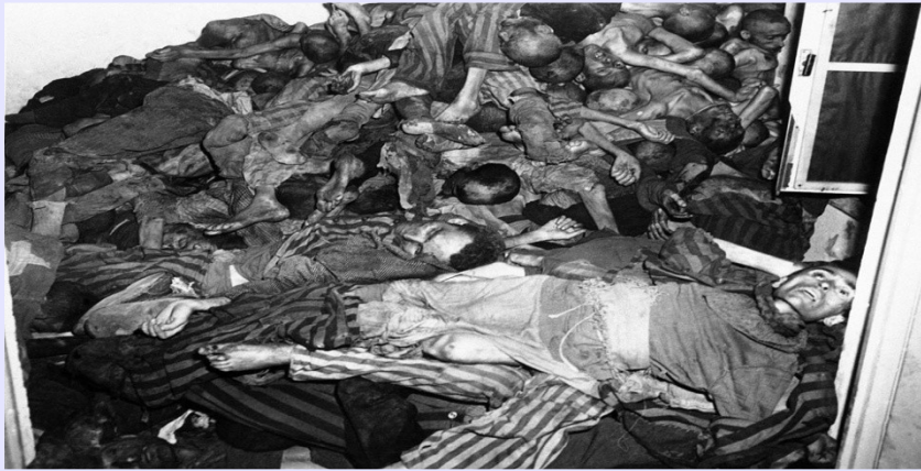
Koncentračný tábor v Dachau. Telá ležia nahromadené v miestnosti krematória.