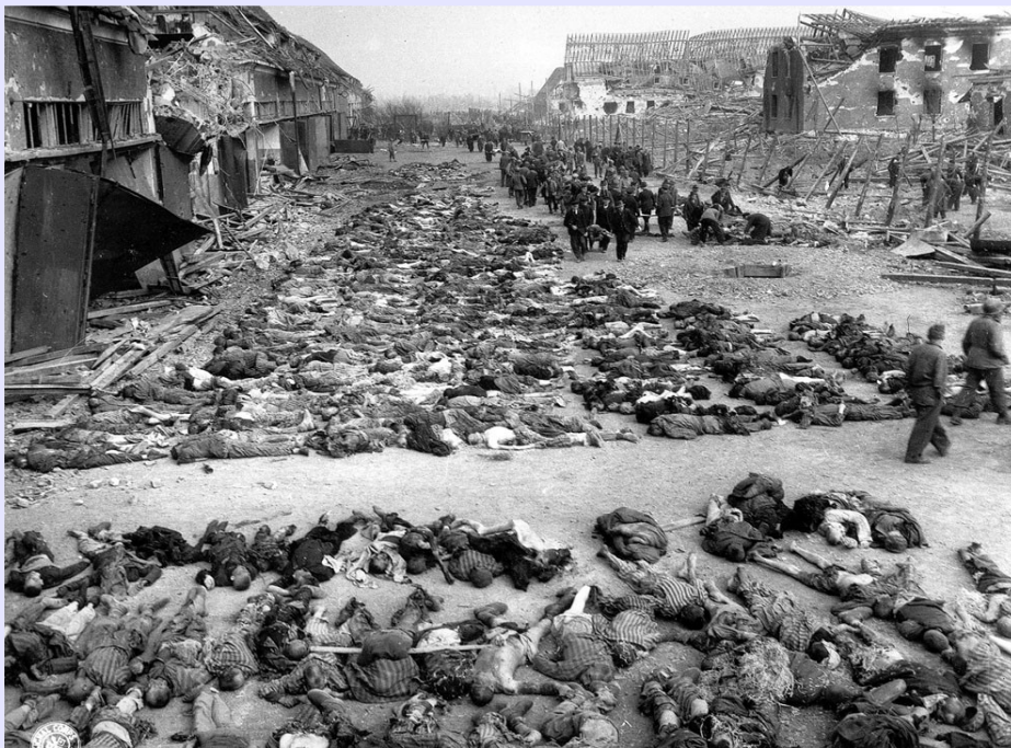
Koncentračný tábor v Nordhausene v Nemecku. Keď ho 12. apríla americká armáda oslobodila, našla viac ako 3000 mŕtvých tiel, ale len hŕstku ľudí, ktorí prežili.